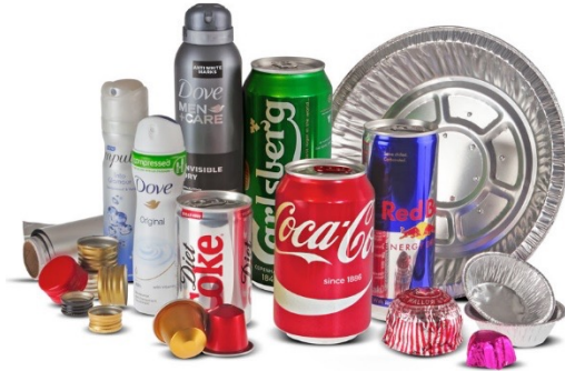
Conteneurs en aluminium