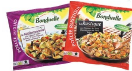
Aluminium mélangé avec du plastique ou du papier