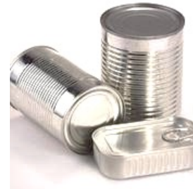
Boîtes de conserves en aluminium