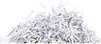
Archives / Brouillons / Couleur / Blanc