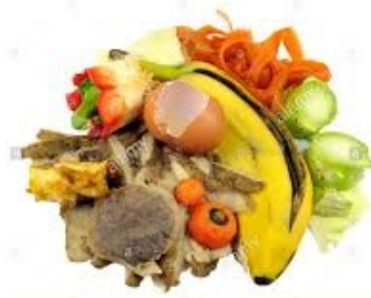
Fruits et légumes