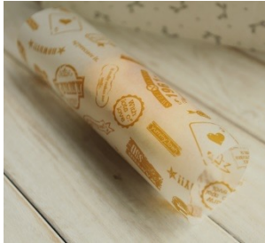
Enduit de cire