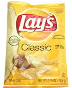
Paquets de chips