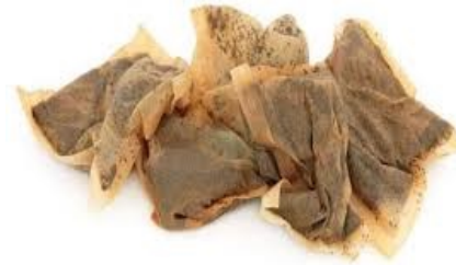
Sacs et paille de thé