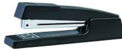
Accessoires de bureau